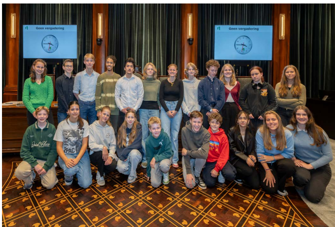
Eerste bijeenkomst Jongerenraad