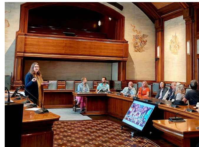
Rondleiding Open Monumentendag