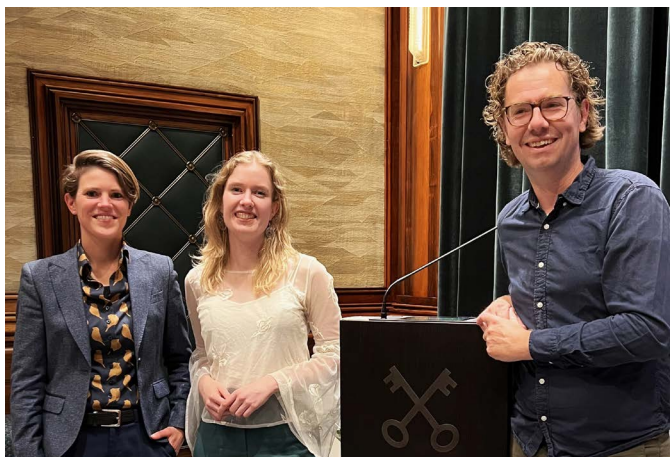
Onthulling 'Stem van de toekomst'