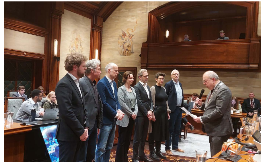
Installatie Rekenkamer Leiden & Leiderdorp

Lees meer over de rekenkamer en de onderzoeken op www.rekenkamerleidenleiderdorp.nl