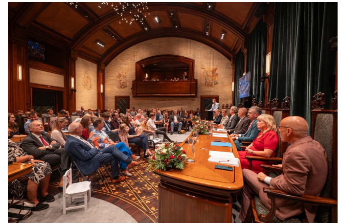
Speech nieuwe burgemeester