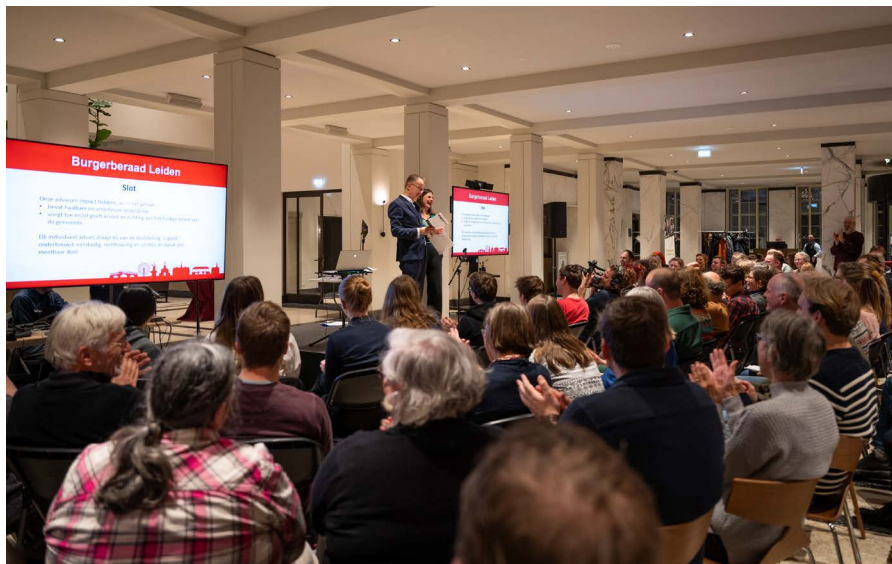
Bijeenkomst Burgerberaad Energietransitie